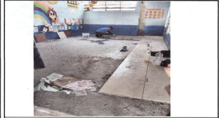
Foto 1: Se pica el piso para prepararlo para sustituirlo por piso.