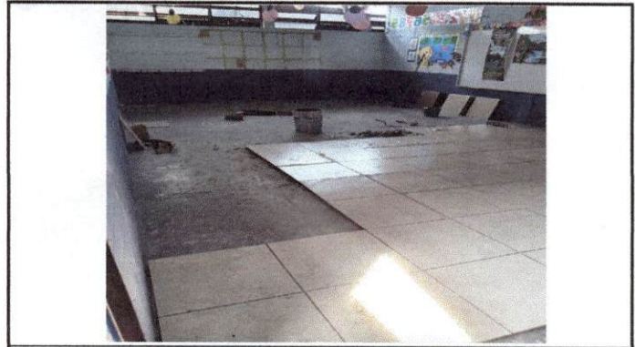
Foto 2: Se pica el piso para prepararlo para sustituirlo por piso.