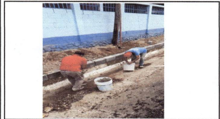
Foto 3: En esta parte se tuvo que limpiar, aplanar y rellenar el terreno para luego formar la banqueta, lado izquierdo del frente de la escuela.