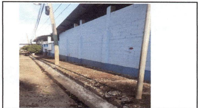
Foto 4: En esta parte se tuvo que limpiar, aplanar y rellenar el terreno para luego formar la banqueta.